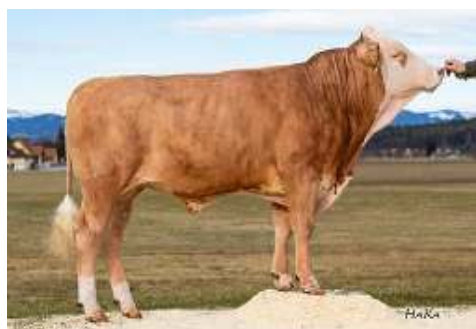
Otec: HUBERBUA HCH-083