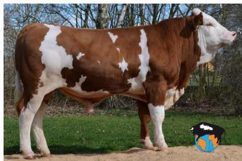
Otec: BD-100 SISYPHUS